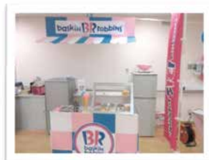
サーティワンアイスクリーム